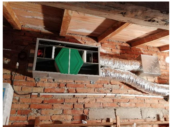
Foto di cantiere