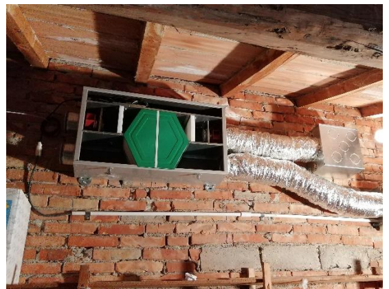
Foto di cantiere